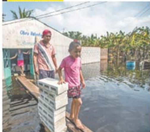
GERMÁN ESPINOSA/EL UNIVERSAL